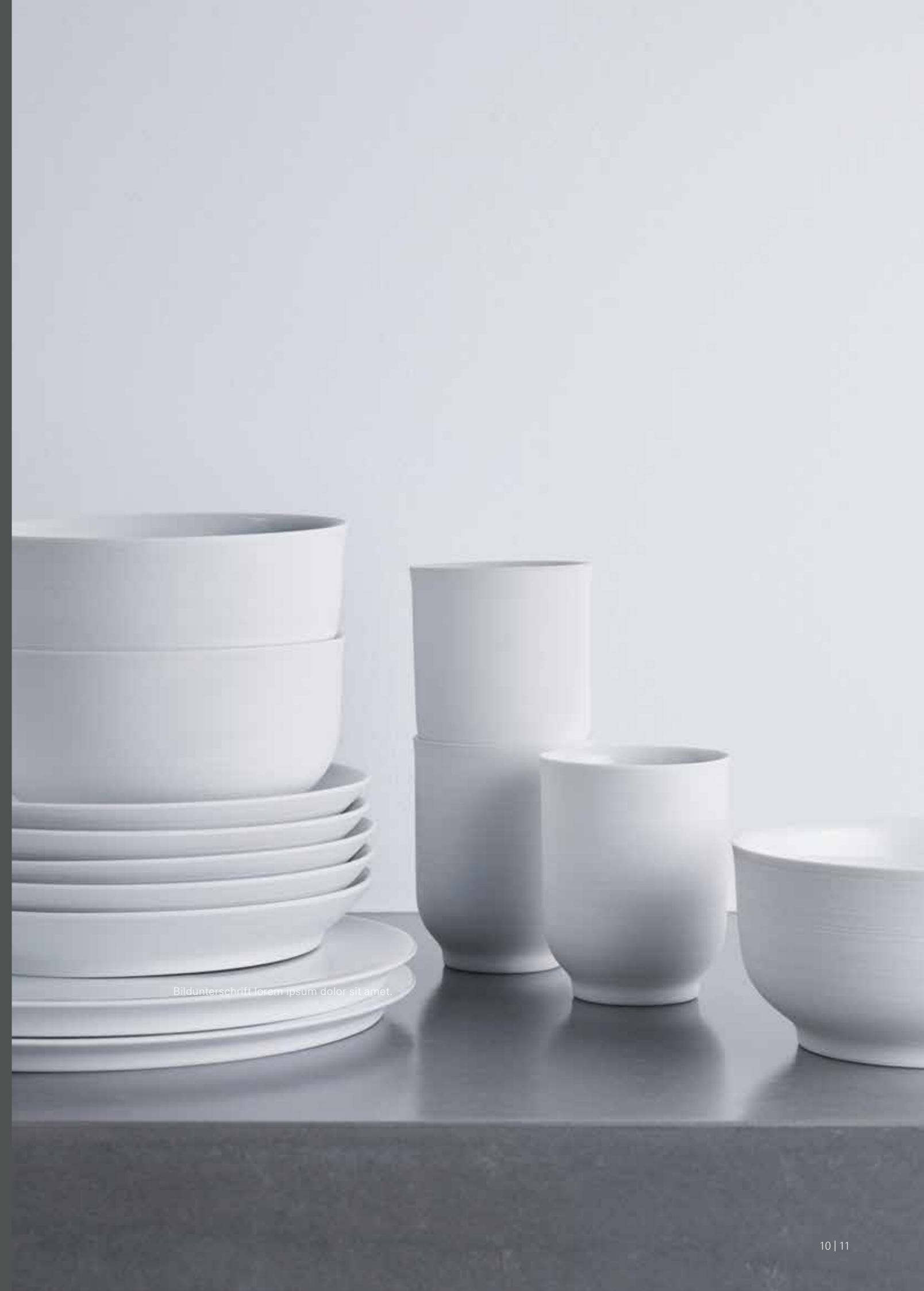
Bildunterschrift Lorem ipsum dolor sit amet.

The final touches are then added to OMNIA with the hand-polishing of each bowl, mug and plate to create the silky smooth finish.