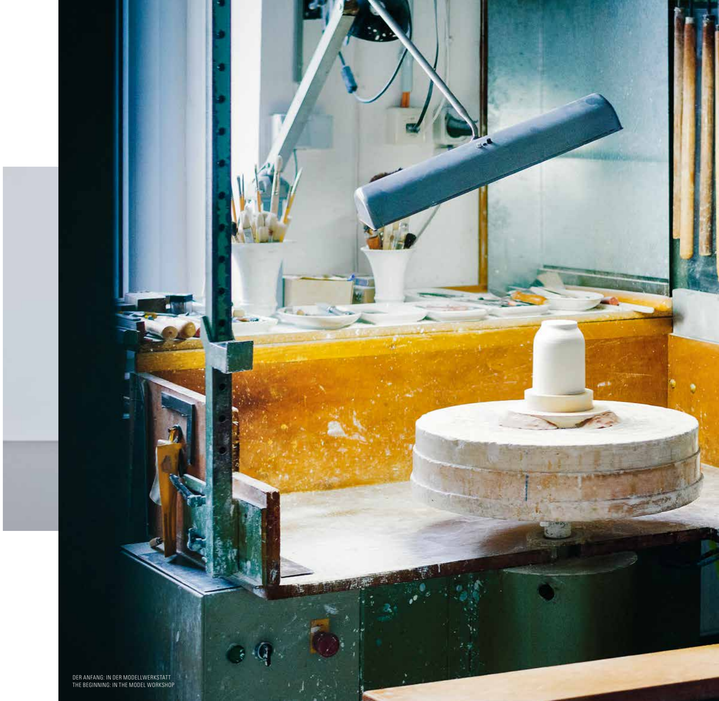
DER ANFANG: IN DER MODELLWERKSTATT THE BEGINNING: IN THE MODEL WORKSHOP