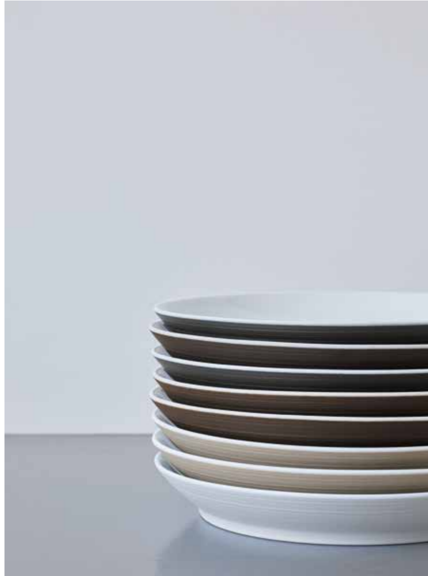
DIE FEINEN RILLEN VERLEIHEN OMNIA DIE BESONDERE HAPTİK THE FINE GROOVES GIVE OMNIA A SPECIAL FEEL