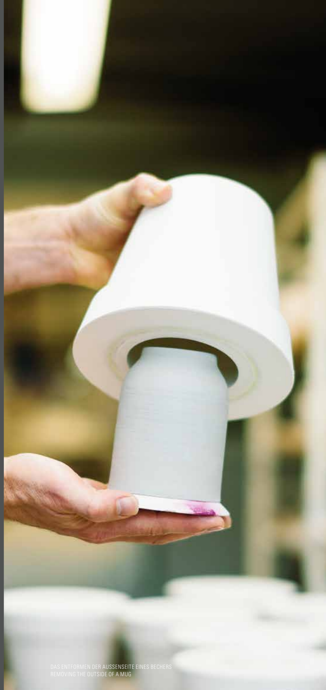
DAS ENTFORMEN DER AUSSENSEITE EINES BECHERS REMOVING THE OUTSIDE OF A MUG