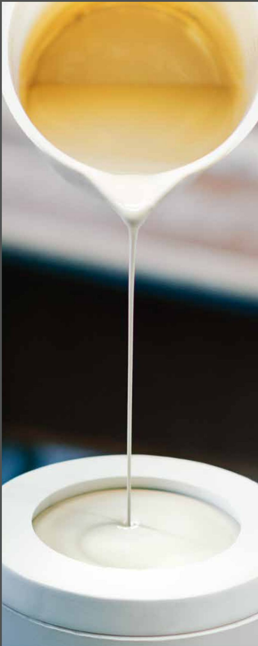
EINGESSEN DES PORZELLANSCHLICHERS IN DIE GIESSFORM POURING THE CASTING SLIP INTO THE MOULD