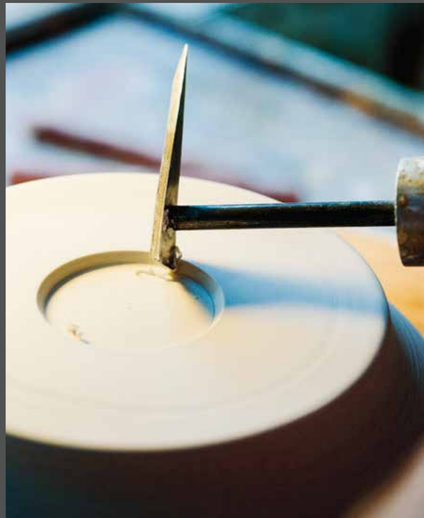
PRÄZISE NACHDREHEN EINES DETAILS IM GIPSMODELL PRECISE REWORKING OF A DETAIL IN THE PLASTER MODEL