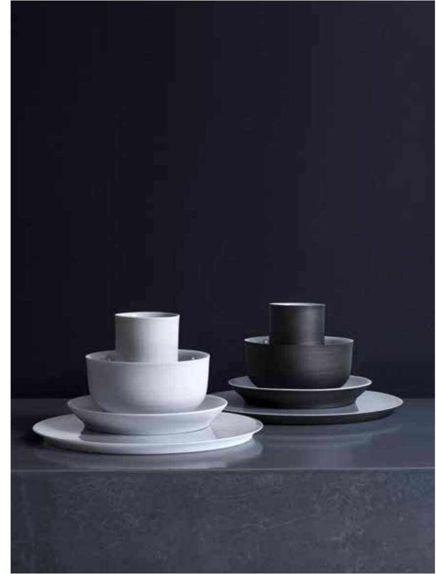
OMNIA IST MIT NUR VIER TEILEN AUF ALLES EINGESTELLT OMNIA MAY ONLY HAVE FOUR COMPONENTS, BUT IT IS READY FOR ANYTHING