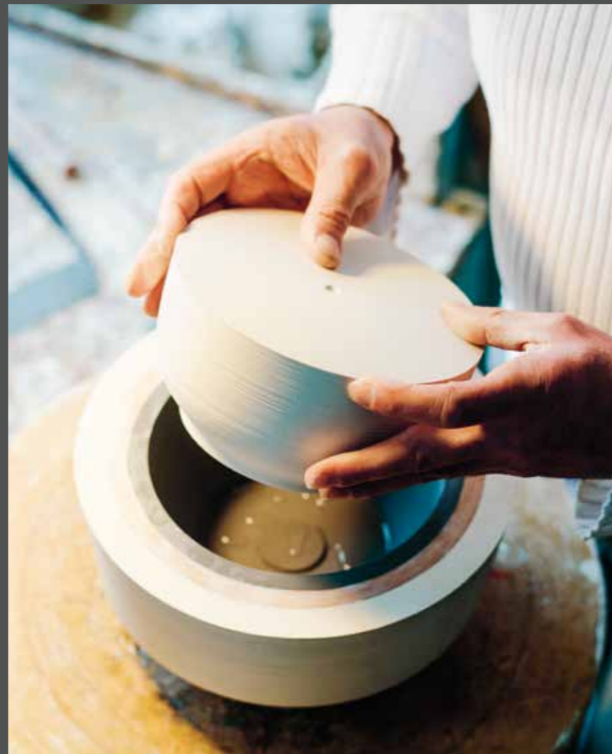
ERSTE UMGÜSSE DES GIPSMODELLS THE FIRST CASTING OF THE PLASTER MODEL