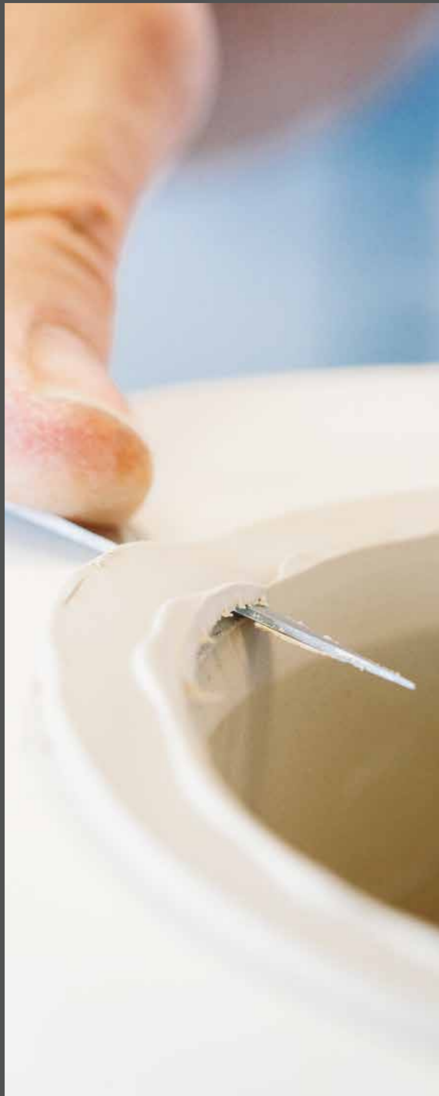
KLEINSTE DETAILS MACHEN DEN UNTERSCHIED THE SMALLEST DETAILS MAKE THE DIFFERENCE