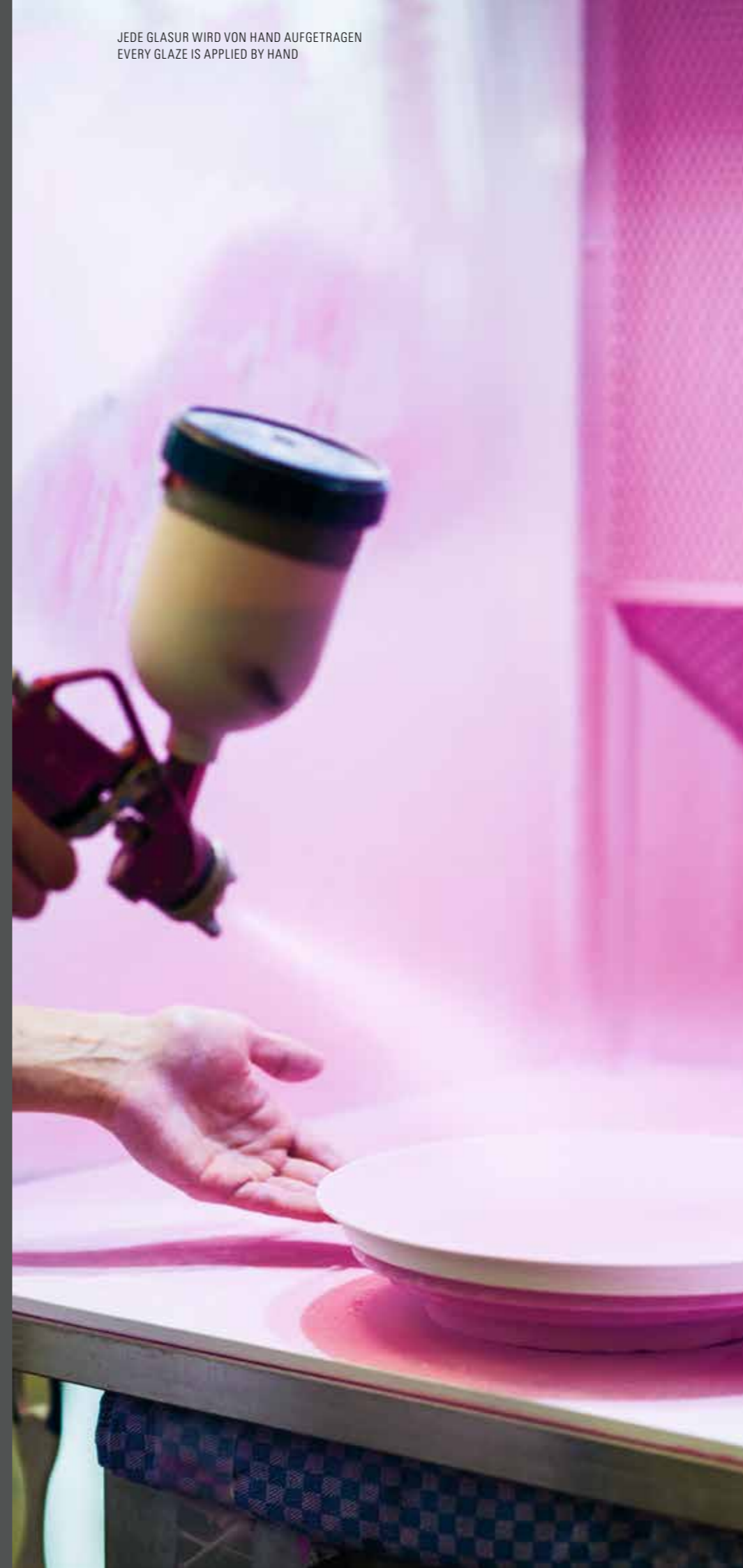
JEDE GLASUR WIRD VON HAND AUFGETRAGEN EVERY GLAZE IS APPLIED BY HAND