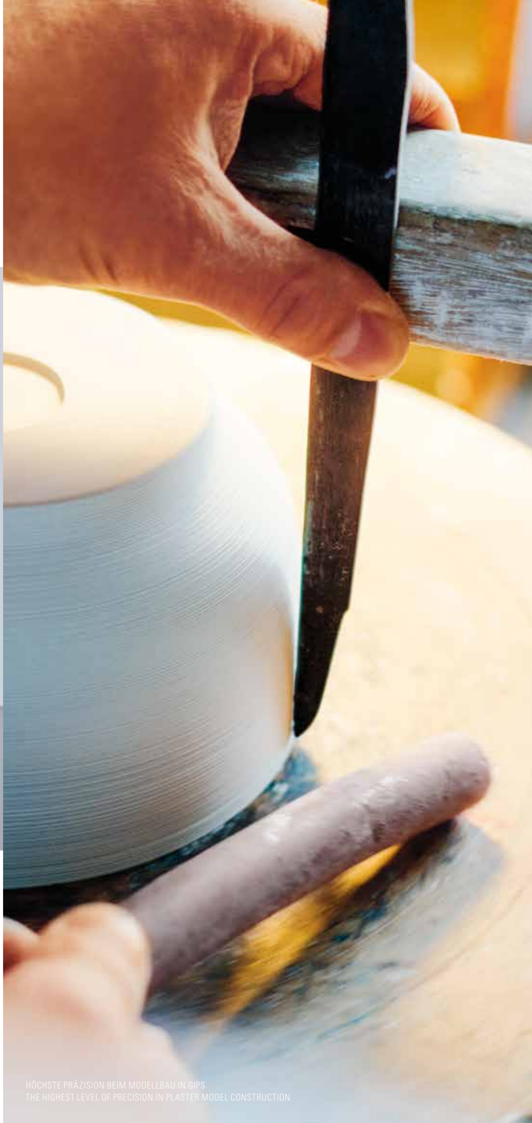
HÖCHSTE PRÄZISION BEIM MODELLBAU IN GIPS THE HIGHEST LEVEL OF PRECISION IN PLASTER MODEL CONSTRUCTION